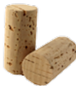
beta 130/225 kg/m 3