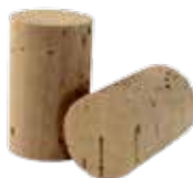
alfa core 130/225 kg/m 3